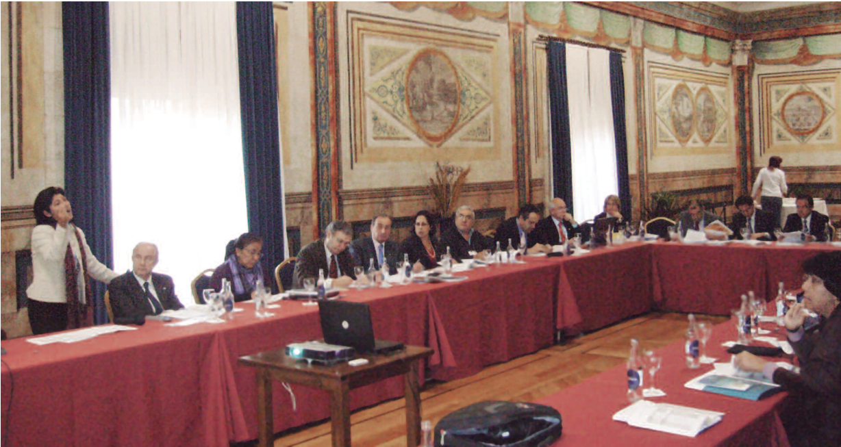
Reunión Técnica Internacional. Universidad de Salamanca