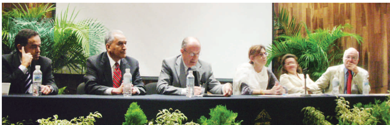
Universidad Autónoma de Yucatán. Congreso Nacional de Postgrado