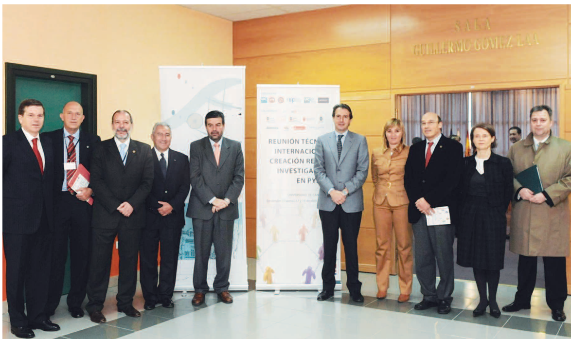
Universidad de Cantabria. Acto de inauguración de la Reunión Técnica Internacional