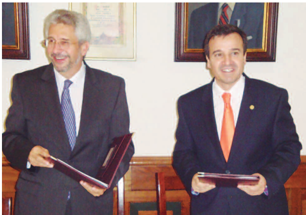
Bogotá, Colombia, 23 y 24 de octubre de 2008