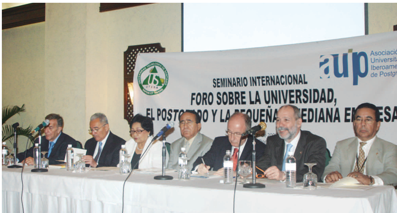
Acto de inauguración del Foro sobre Universidad, Postgrado y PYMES