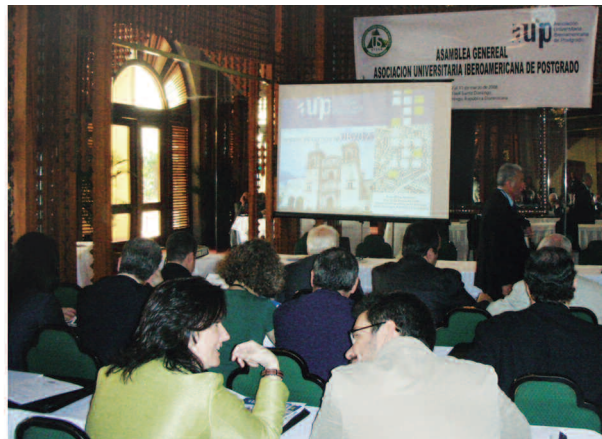
Santo Domingo, República Dominicana, 10 y 11 de marzo de 2008